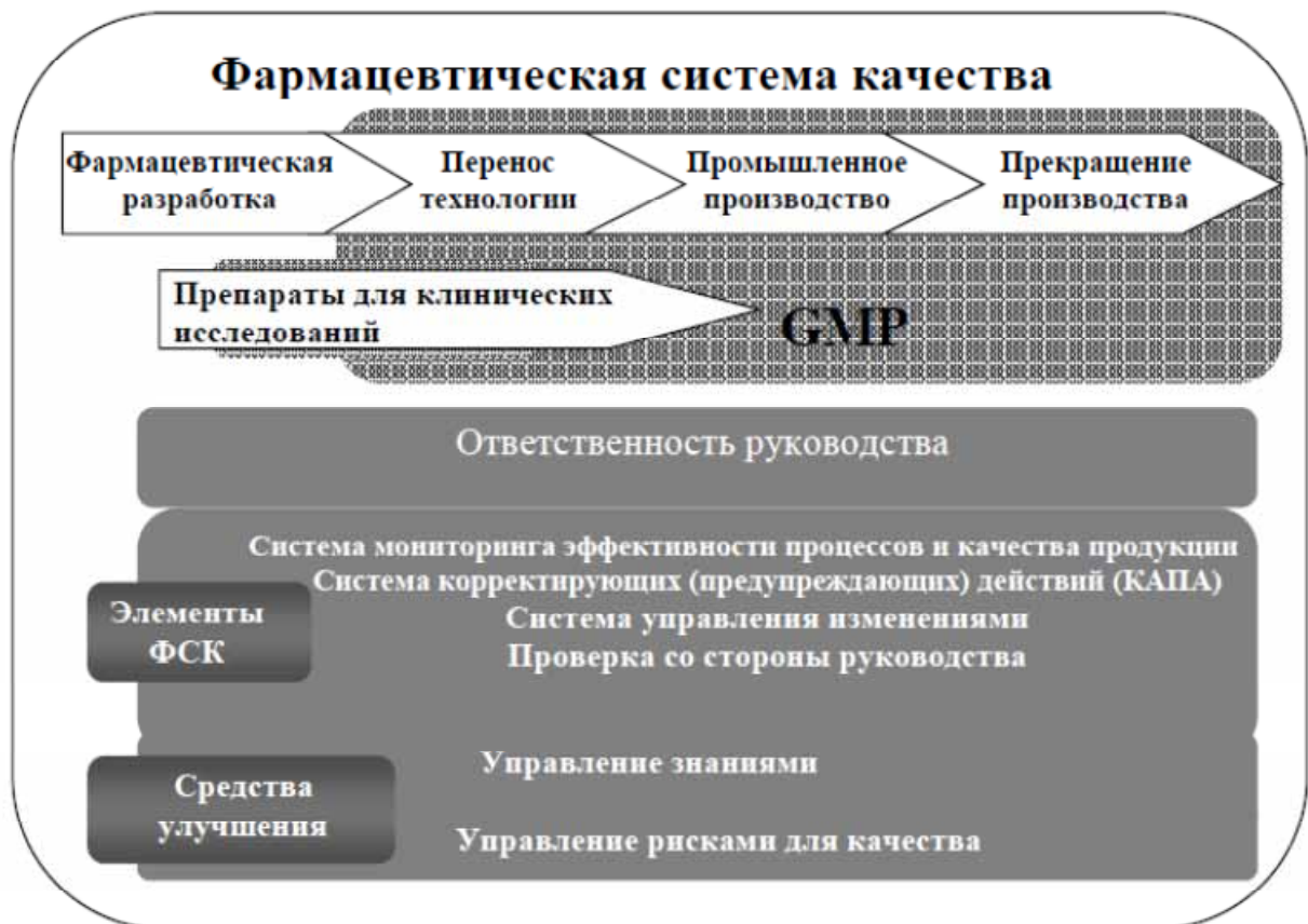
СХЕМА модели фармацевтической системы качества

На схеме показаны основные особенности модели фармацевтической системы качества (далее – ФСК). ФСК охватывает весь жизненный цикл продукции, включая фармацевтическую разработку, перенос технологии, промышленное производство и прекращение производства.